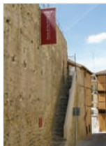
Acceso al Centro Informativo de la Muralla y su adarve

Como puede leerse en esta lápida, en la ciudad de Segovia nació y tuvo sus andanzas el Buscón don Pablos, personaje principal de la obra de Francisco de Quevedo