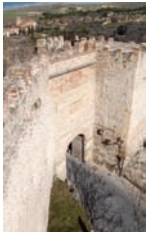
P. de San Cebrián

De las tres puertas que se conservan de la Muralla, ésta es la más monumental y la que muestra un aspecto más defensivo. Este aspecto se lo confiere el arco de medio punto que se sujeta en dos torres, una de planta cuadrada y otra poligonal, con saeteras y rematadas por almenas. Fue declarada Monumento Histórico - Artístico el 3 de junio de 1931, 10 años antes de que la Muralla, junto con sus puertas y postigos obtuviesen el mismo título, el 12 de julio de 1941.