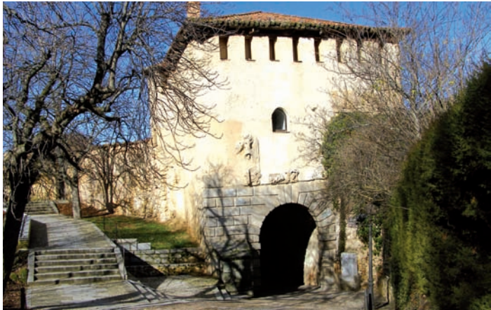
P. de Santiago

Está situada en el Paseo de San Juan de la Cruz; tiene fachada exterior de arco de herradura, que data del siglo XIII , mientras que la interior muestra arco de medio punto y es el resultado de una reforma barroca llevada a cabo a finales del XVII y principios del XVIII .