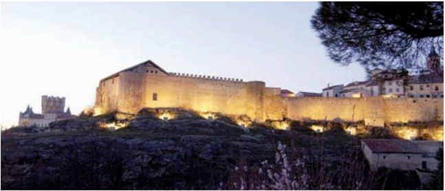
Vista de la Muralla desde Cuesta de los Hoyos

Es el Conde Raimundo de Borgoña, yerno del rey Alfonso VI, el encargado de la repoblación de la ciudad, y aunque no exista documentación al respecto, se cree que también fue él quien encargó la construcción de la Muralla.