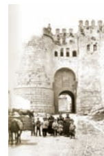
Puerta de San Andrés, 1888

La puerta de San Andrés aparece documentada por primera vez en 1120, aunque su aspecto actual es consecuencia de las obras que se llevaron a cabo a finales del siglo XV o principios del XVI; no se sabe exactamente si estas reformas tuvieron lugar bajo el reinado de los Reyes Católicos o del Emperador Carlos V, aunque realmente no se puede hablar de obras reales ya que, en Segovia, las obras de las puertas de la Muralla, correspondían a los Condes de Chinchón, encargados de su mantenimiento y restauración, así como de nombrar a sus alcaides.