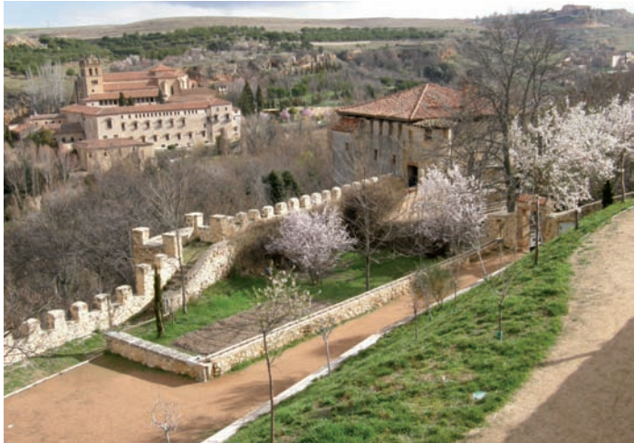
Jardín de los Poetas, junto a la Muralla, a su derecha la Puerta de Santiago. Y al fondo, el Monasterio de El Parral.

La puerta permitía el acceso a la ciudad desde la carretera del Arévalo y el barrio de San Marcos, con la proximidad de la Casa de la Moneda y el Monasterio del Parral, lo que la convertía en un punto importante de paso a la ciudad.