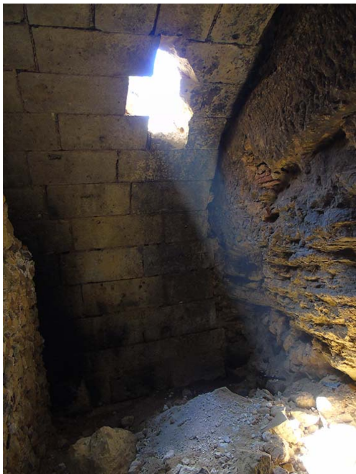
Interior de la bóveda de la cueva de San Juan.

Es una bóveda, parcialmente cegada, que se ha localizado en el subsuelo a la altura del cubo de la muralla que está junto a la casa de las Cadenas. Se trata de una bóveda realizada con sillares de caliza, de 2,3 m de profundidad, 5,4 m de ancho y 3,4 m de altura máxima. En la parte superior, esta bóveda está cubierta por una fábrica de mampostería bastante suelta.